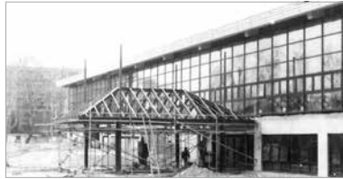
Harmincöt éve nem történt komolyabb fejlesztés az intézményben

Az elmúlt harmincöt évben a kisebb karbantartásokat leszámítva komolyabb fejlesztés nem történt a Csitáry G. Emil Uszodában, annak komplex felújítása már évek óta