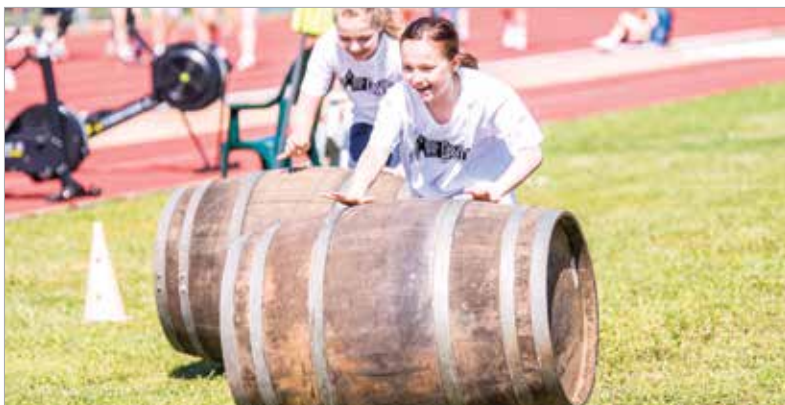
Nemcsak bemutakoztak a sportágak, de ki is lehetett azokat próbálni