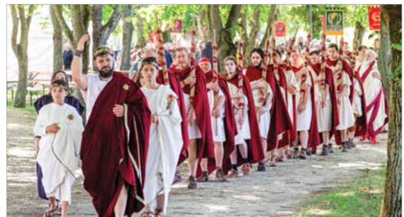
Septimius Severus császár és kísérete 202-ben sem vonulhatott be ennél nagyobb pompával!