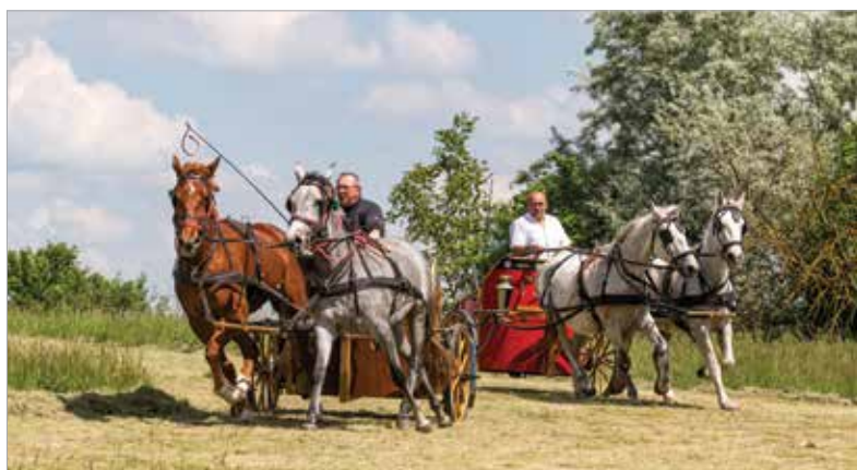
Idén is volt fogathajtó verseny