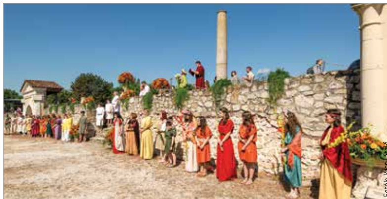
Flora istennő elhozta a tavaszt

Császári bevonulás, díszelőadás, fogathajtó verseny, légióstáborok és kézművesek várták az érdeklődőket a múlt hétféjén: a Gorsium