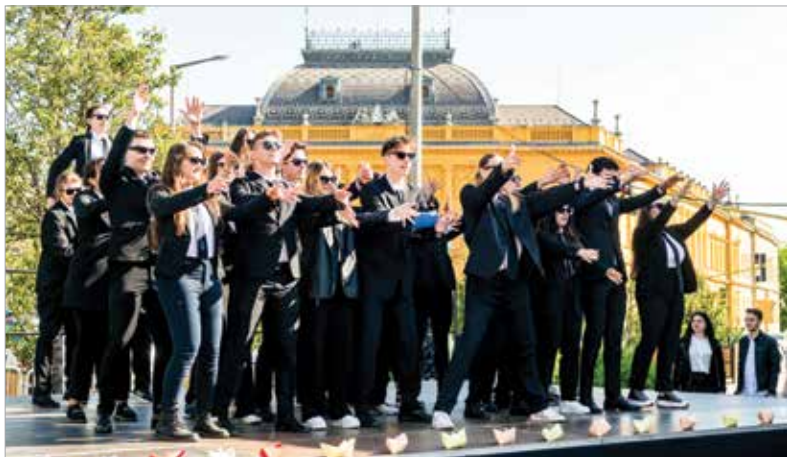
A titkosügynökök ezúttal csak a fehérváriaknak táncoltak

A ballagási hét legvidámabb eseménye zajlott kedden délelőtt a belvárosban: a Bolondballagásra idén tizenhárom osztály nevezett, és kilenc mutatta be táncos produkcióját a Zichy ligeti színpadon. A fődíjasok idén is 175, 125 és 100 ezer forintos támogatást kaptak a város önkormányzatától az érettségi bankett megrendezéséhez. A legjobbaknak járó fődíjat végül a telekis kalózok vitték el, második lett a Tóparti 12. B osztálya. A harmadik helyen is tópartisok végeztek, mégpedig a 12. D-sek.