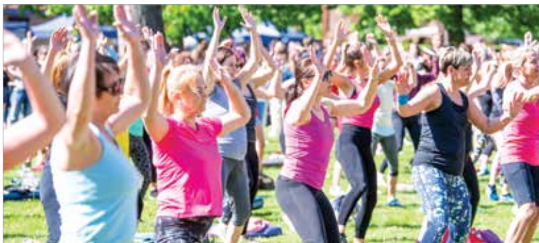
Az atlétikai centrumban a profik és a kezdő mozgolódni vágyók idén is együtt edzhettek