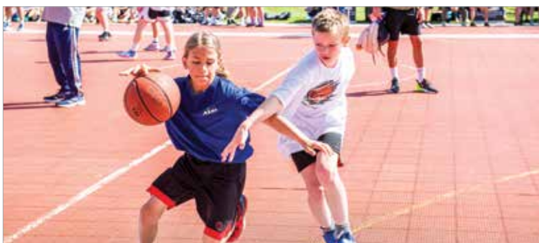
A korosztályok és nemek alkotta streetballcsapatok versenyében családok közötti mérkőzések is szerepeltek