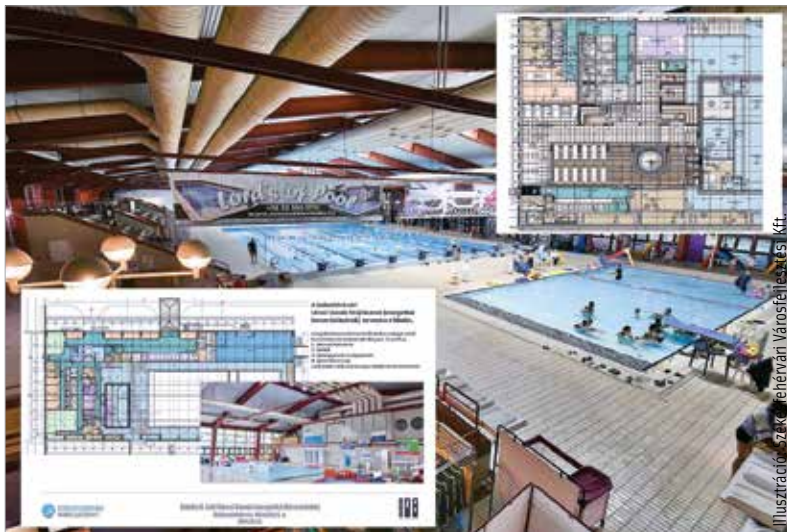
A teljes energetikai felújításon túl komoly funkcióbővítést is tartalmaz a múlt csütörtökön bemutatott terv

A felújítás terveiről készült prezentáció a város honlapjáról, a www.szekesfehervar.hu oldalról tölthető le.