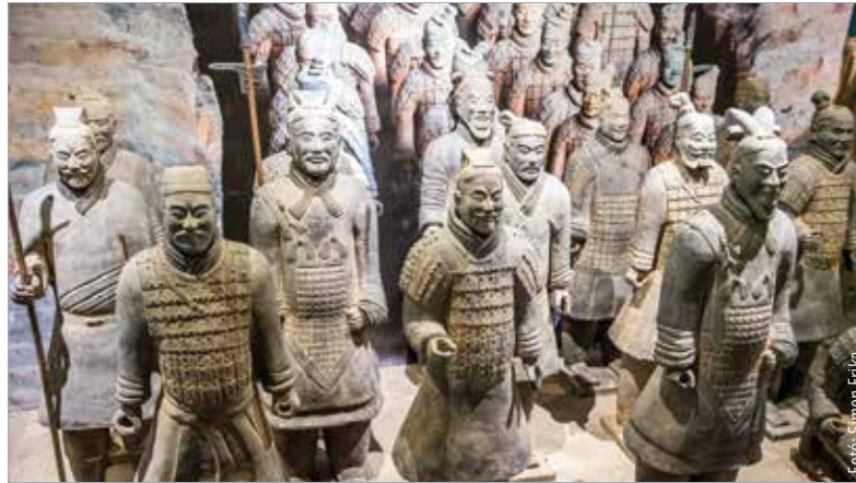
A kiállítás augusztus tizenkilencedikéig látható Gorsiumban

Mára kiderült, hogy mintegy kétezer-kétszáz éve összesen négy árktól ástak az agyaghadsereg számára, melyekben a becslések alapján nagyjából nyolcezer szobor lehet – a régészeti feltárások napjainkban is folynak. A föld alá temetett hadsereg, mely