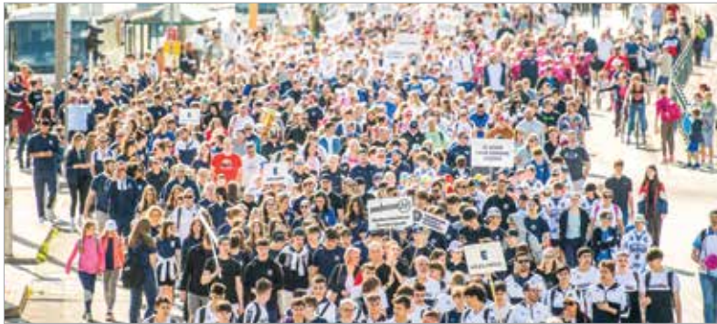
A Petőfi parktól a Bregyó közig tartó hagyományos felvonuláson idén is több ezer sportoló vett részt