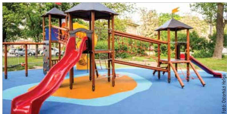
A háromtornyos, biztonságos játékvárat egyedi, mintás gumiburkolat veszi körül