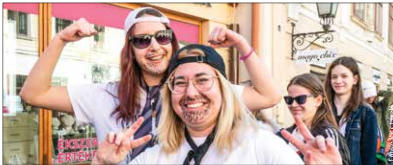
A vidám menet résztvevői a Liszt Ferenc utcából indulva végigvonultak a belvárosban