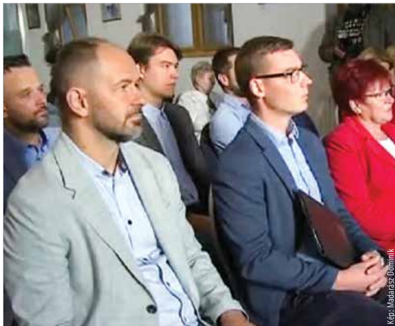
A VÁLASZ mind a tizennégy fehérvári egyéni választókerületben indít képviselőjelöltet

Az est kiemelt eseménye volt a szerződéskötés a választókkal, mely szerint a VÁLASZ jelöltjei vállalják, hogy az egész ciklus ideje alatt visszahívhatók lesznek.