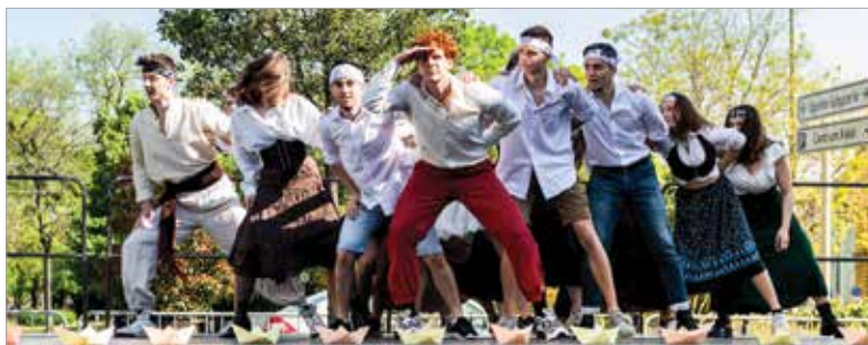
A telekis kalózok lettek a legjobbak, ők már a jövőbe tekintenek