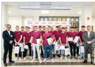
Tizennyolc diák vehetett át oklevelet a cég jubileumi ünnepségén

A Denso Gyártó Magyarország Kft. huszonhat éve van jelen Székesfehérváron. A folyamatos fejlődésnek köszönhetően ma már közel ötezer munkavállalót foglalkoztat. A gépjárműalkatrész-gyártó vállalat vezetősége hisz abban, hogy a szakmai és a személyes fejlődés a távlati célok megvalósításának kulcsa, éppen ezért 2014-ben bekapcsolódtak a duális szakképzésbe, hogy a diákok elméleti oktatását gyakorlati tudással egészítsék ki. „Ha az ipar növekszik, akkor a város is fejlődni tud, az itt élők egzisztenciális lehetőségei javulnak. Azonban a technológia folyamatosan változik, így a szakképzett munkaerő biztosításában segíteni kell a cégeket, iskolákat, szakképzési centrumokat, a